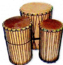
des dun-dun ou dum-dum